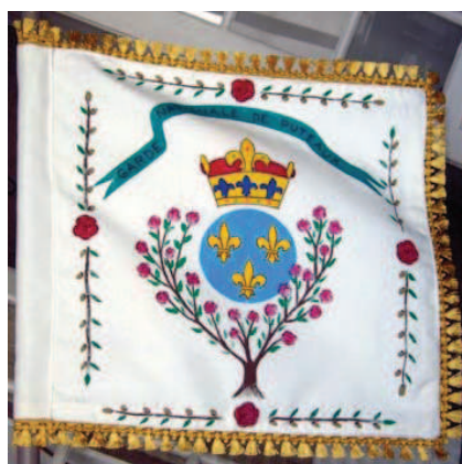
Peintures de Raymond Hanser d'après dessins de François Texier